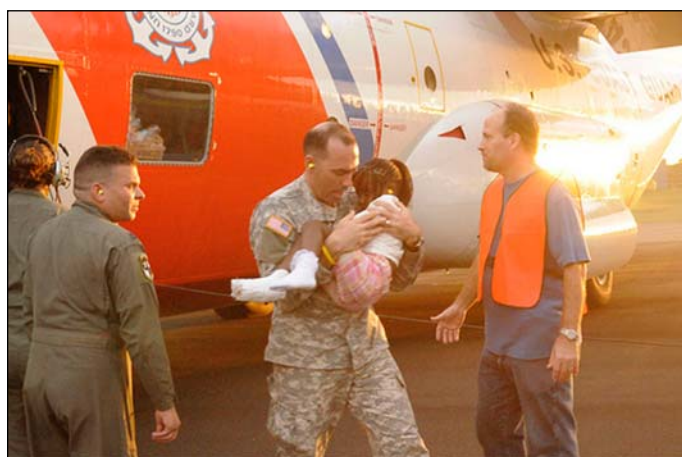
Santo Domingo, 14 de enero - Un militar estadounidense traslada desde un helicóptero de los Guardacostas de EEUU una niña evacuada de Puerto Príncipe, para recibir tratamiento médico.

En este país hemos vivido experiencias de parecido dramatismo. Basta recordar el proceso de evacuación de niños españoles hacia Rusia durante la Guerra Civil, en los años 30, del que hay múltiples testimonios y documentación. La evacuación se produjo en el bando republicano, para evitar que los desastres de la guerra se cebaran sobre los niños, sobre todo porque era en ese bando donde se producían víctimas entre la población civil y donde las miserias de la guerra, sobre todo en las ciudades grandes, eran más notables. No todos los niños evacuados eran, sin embargo, huérfanos. Algunas familias dejaron marchar a sus hijos convencidos de que fuera de España les esperaba un futuro mejor.