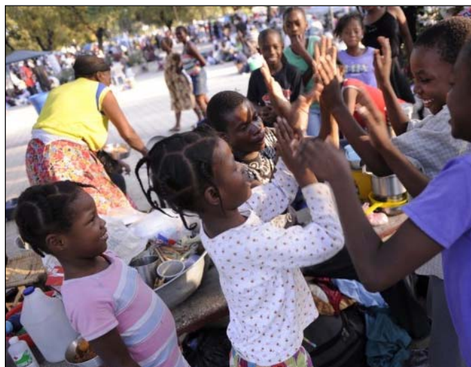
Foto: Haití, 18 de enero - Niños en el aeropuerto de Puerto Príncipe, celebran su pronto traslado.

Tablas estadísticas sobre salud y pobreza de UNICEF: http://www.unicef.org/sowc05/english/sowc05_Tables.pdf , consultado el 11.02.2010