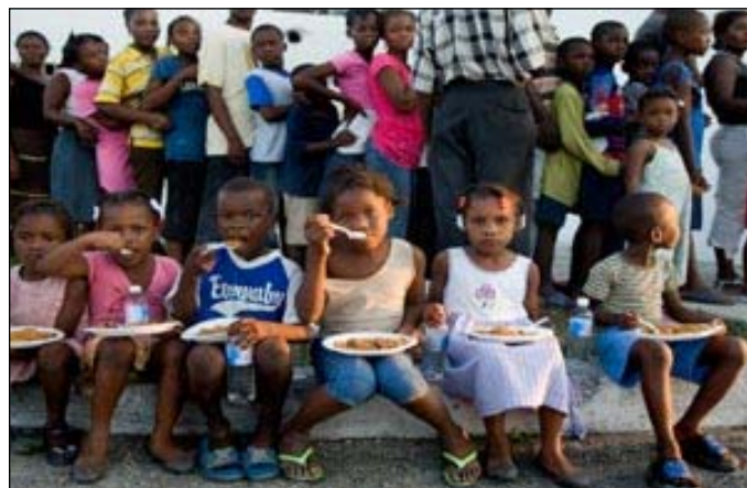
Haití, 15 de enero - Niños comen alimentos distribuidos por efectivos militares bolivianos de la ONU, en Cité Soleil .

Según todos los testimonios, la magnitud de la tragedia de Haití excede todos los supuestos de la imaginación más desatada. Un estado fallido desde hace ya muchos años, establecido sobre un población donde la miseria, la superstición y el desorden, mantienen al