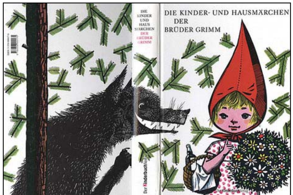
Ilustración de Werner Klemke para las cubiertas del libro Die Kinder- und Hausmärchen , de los Hermanos Grimm (1963).

La familia nuclear de padres e hijos y la "multifamilia" biológica (abuelos, tíos, primos...) o social (amigos, profesionales...), suelen ser el ámbito en el que se desarrollan la mayoría de los niños de nuestro ambiente. El niño a los 4 meses "sale del cascarón social" y emite estímulos de interacción. Según la respuesta que den los miembros de la "Multifamilia" será el efecto en el desarrollo de las habilidades sociales del niño o niña. Si es de satisfacción de la madre que, por ejemplo, le devuelve el sonajero repetidas veces y como decíamos, con placer, de modo que prevalece y con gran diferencia el sí sobre el no. Entonces siente que sí se divierte y ese placer compartido