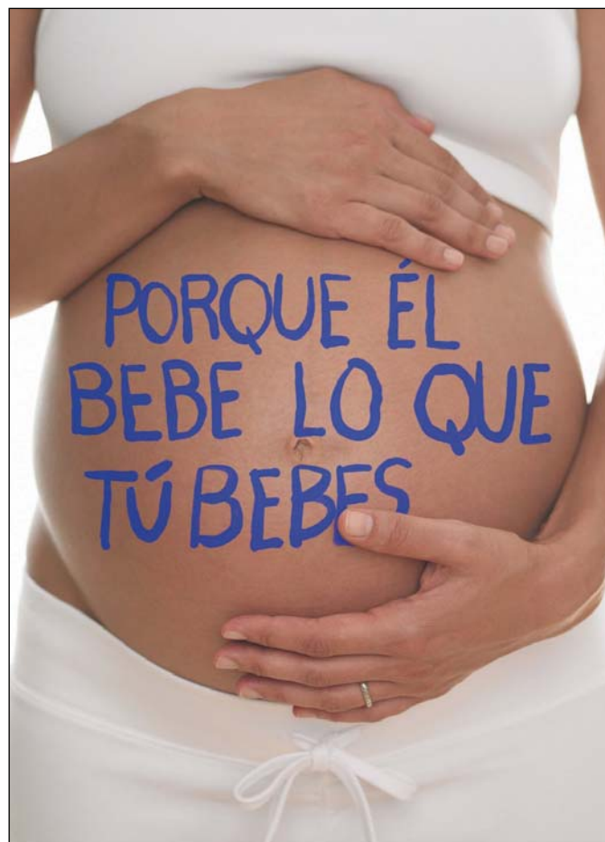
Una campaña realizada recientemente en España, fue la promovida en 2009 por la Sociedad Española de Ginecología y Obstetricia (SEGO) y Cerveceros de España y titulada "Un embarazo sin", a cuyo poster pertenece esta imagen.

Paul Lemoine es el ejemplo de pediatra social de guardería o escuela infantil que indaga no sólo el crecimiento somático de peso y talla sino también el desarrollo psicomotor y psico-afectivo de cada niño y el entorno social donde se desenvuelve. También detecta precozmente cualquier alteración del desarrollo, está en contacto con la psicóloga y las familias, y elabora planes de acogida individuales para niños discapacitados y con enfermedades crónicas.